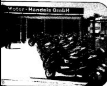
Schieraffenland für Honda-Fans - Motor-Handels GmbH.

Der Traum vieler Männer und Frauen: mit einer Honda quer durch Europa oder mit der Gold Wing um die Welt. Träumen Sie nicht weiter, sondern tun Sie was. Im Honda Shop in Heilbronn (Gewerbegebiet Böllinger Höfe) macht man es Ihnen leicht: auf rund 1.000 Quadratmetern Verkaufsfläche kann man seinen Traum begutachten und anschließend Probe fahren. Hier findet man und frau über 200 verschiedene Fahrzeuge - von 50 bis 1500 ccm.