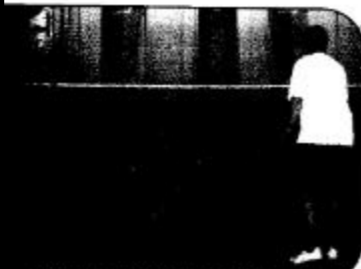
Bis in die Nachtstunden wird in der Jahnhalle geklopft.