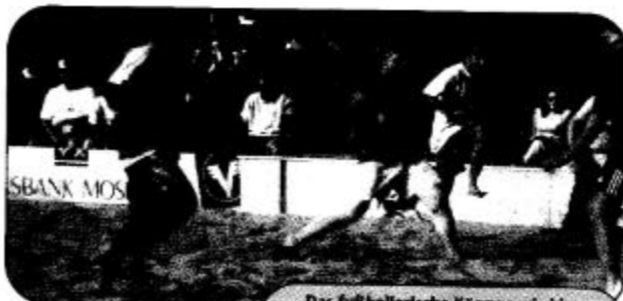
Das fußballerische Können wird im Sand auf eine ganz besondere Probe gestellt.

Im Rahmen des 90jährigen Jubiläums des TSV Badenia Schwarzach findet am 22. Juli das 2. Beach-Soccer Turnier auf dem Vereinsgelände statt. Und so einfach geht es, mit dabei zu sein: ein Team bilden aus drei Feld- und drei Auswechselspielern. Das Mindestalter der Teilnehmer beträgt 18 Jahre. Anmelden kann man sich unter Nennung des Namens des Freizeitspieler-Teams sowie des Namens, der Adresse und Telefonnummer des Spielführers. Die Anmeldungen nimmt Walburga Schardt, Schöne